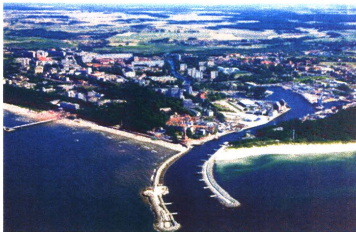
Kolobrzeg kalles den baltiske perle med sine lange og brede sandstrender.