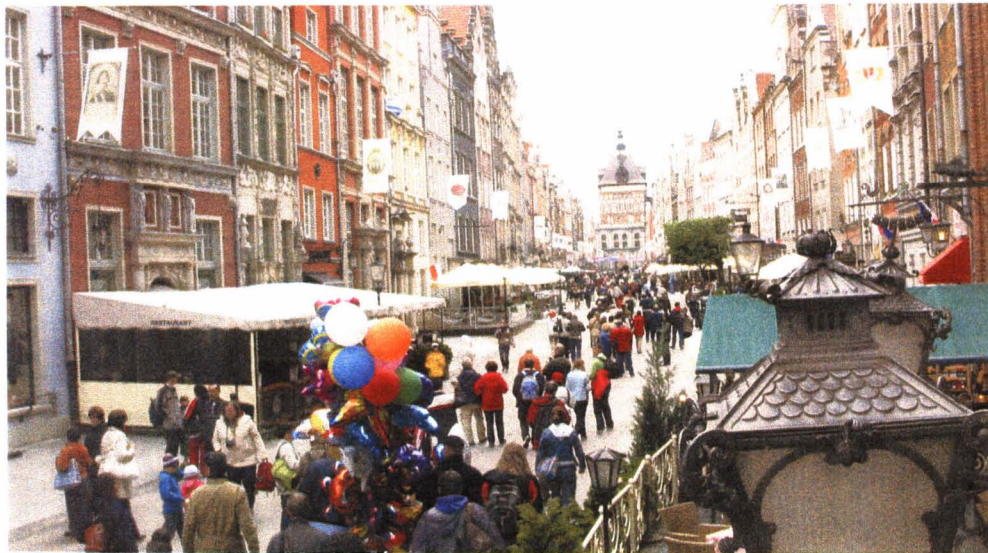
Gdansk er som en levende historiebok.