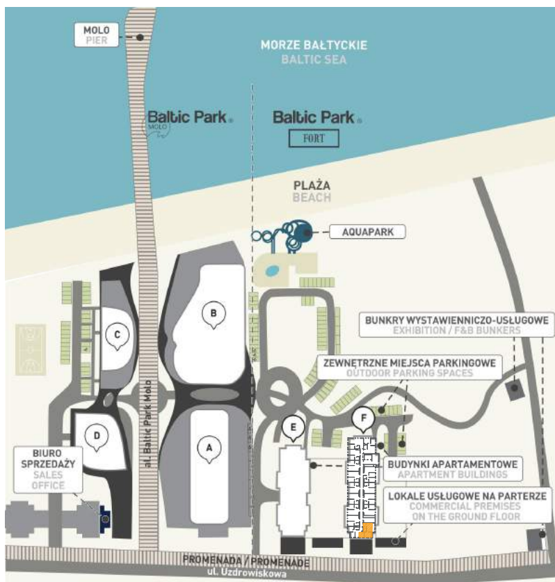
Kompleks i lokalizacja lokalu na piętrze I Complex and location of the apartment on the floor