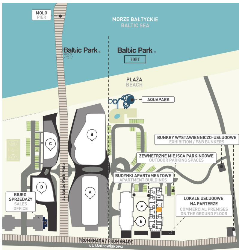
Kompleks i lokalizacja lokalu na piętrze I Complex and location of the apartment on the floor