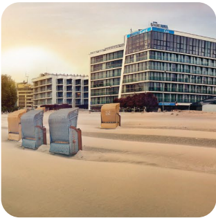
Marine Hotel***** & Ultra Marine, Kołobrzeg

ul. Marszałkowska 72/17 00-545 Warszawa, Poland T/F +48 91 40 40 440 media@zdrojowainvest.pl www.zdrojowainvest.pl