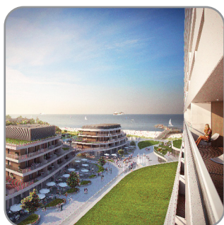
Baltic Park Molo, Świnoujście