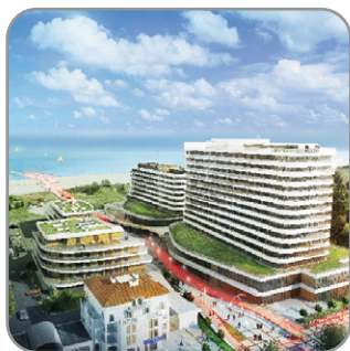
Baltic Park Molo, Świnoujście