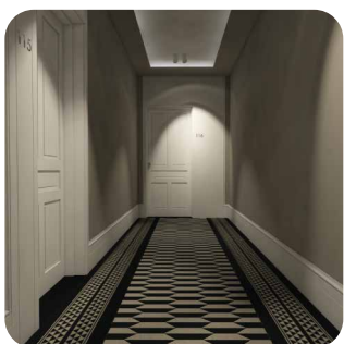
Baltic Park Fort Świnoujście

infrastrukturze drogowej. Jest także deweloperem oraz zarządcą budynku biurowego klasy A Diamante Plaza w Krakowie.