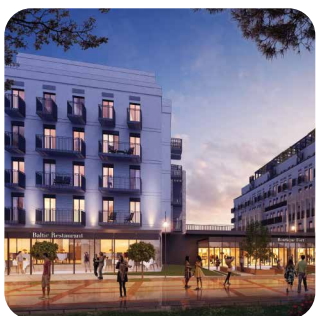
Baltic Park Fort Świnoujście