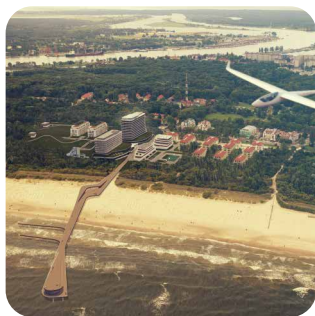
Baltic Park Fort Świnoujście