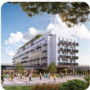
Baltic Park Fort Świnoujście